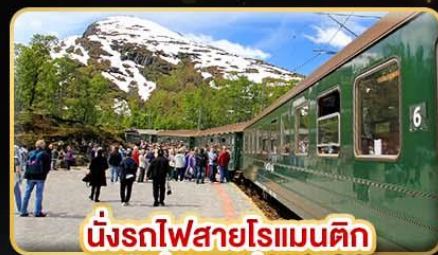
นั่งรถไฟสายโรแมนติก “ฟรอมสพานา”