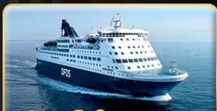
พิกบนเรือสำราญ DFDS