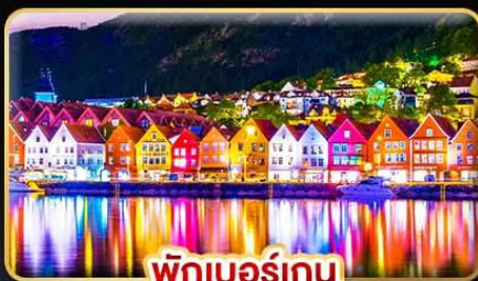
พิกเบอร์เกน